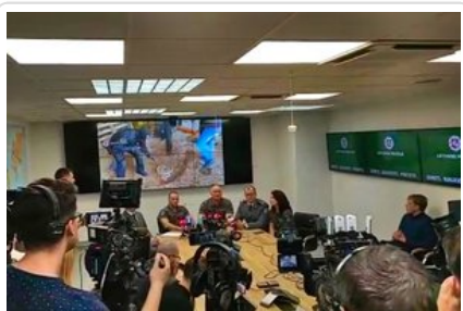
Konferencja prasowa na Litwie