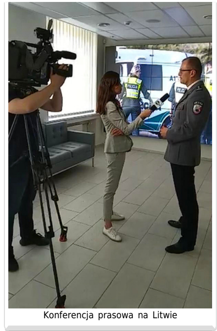
Konferencja prasowa na Litwie

Aby obejrzeć film włącz obsługę JavaScript w swojej przeglądarce.