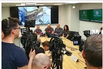
Konferencja prasowa na Litwie