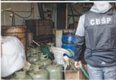
Czynności wykonywane w Holandii