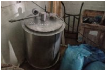
Czynności wykonywane w Holandii