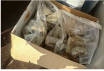
Czynności wykonywane w Holandii