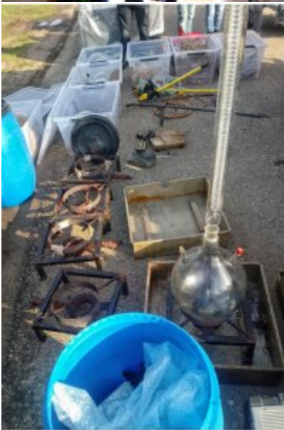
Czynności wykonywane w Holandii