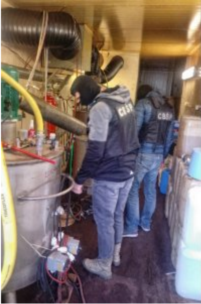
Czynności wykonywane w Holandii