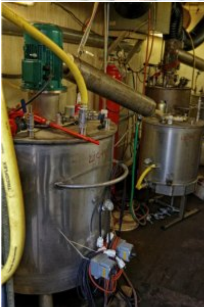
Czynności wykonywane w Holandii