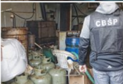
Czynności wykonywane w Holandii